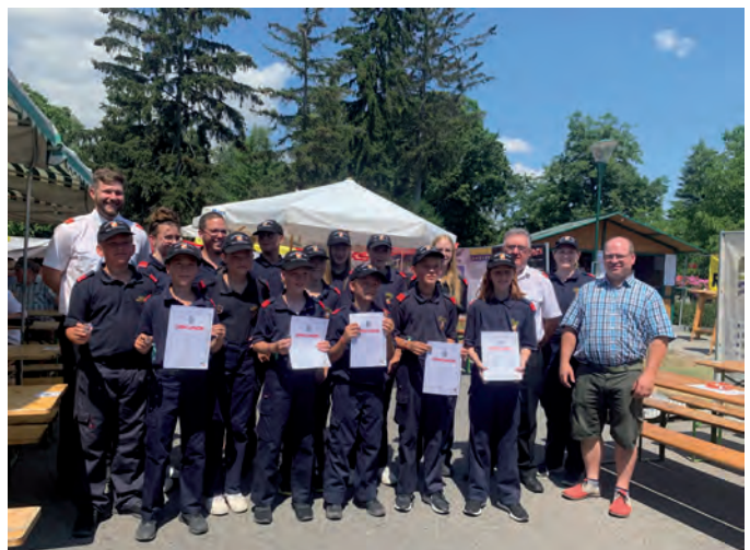
Die verdienten Abzeichen bekamen die Jugendmitglieder beim FF-Heuriger überreicht.