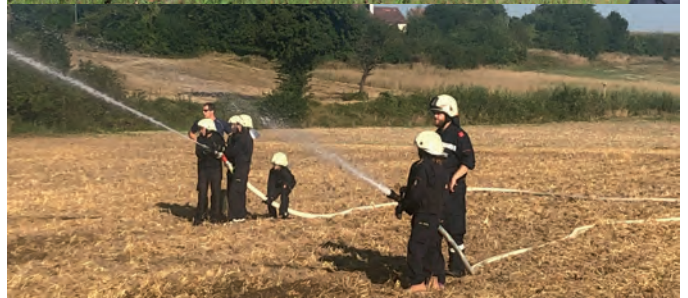
Video 1 (Teaser):