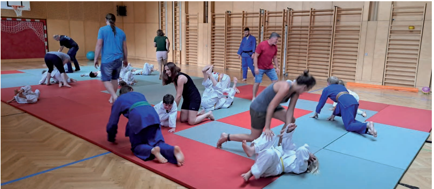
Das Eltern-Kind-Training macht schon wieder Lust auf die nächsten Trainings!